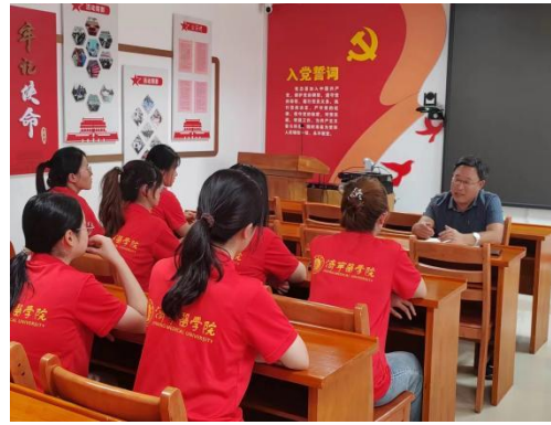
(指导教师: 王峰; 通讯员: 郭晓芮、党启南)