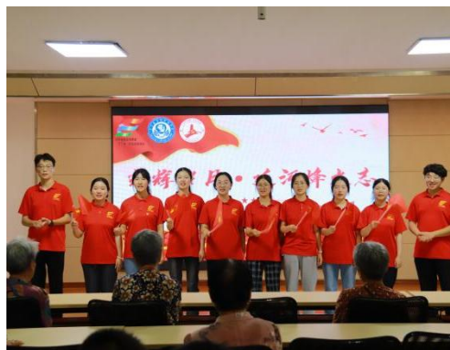
(指导教师: 张莉莉; 通讯员: 周璇)