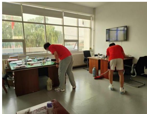
(指导教师：宋慧敏；通讯员：耿萧宁)