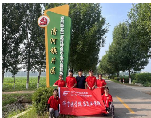
(指导老师：王思宇；通讯员：张俊泽)