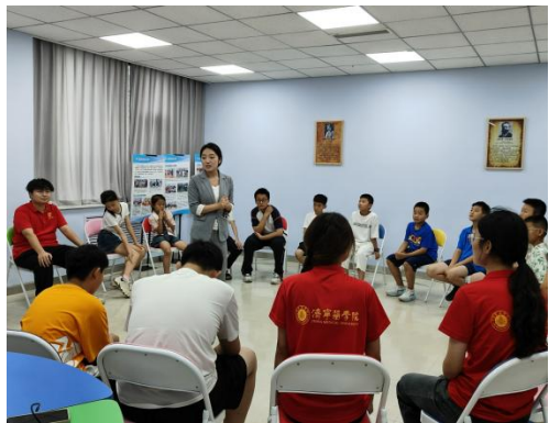
(指导教师: 闫迎春; 通讯员: 苏靖涵)