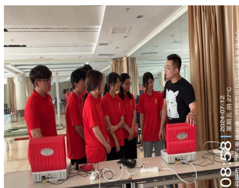
(指导老师：刘敬豪、任宇佳；通讯员：刘志涵)