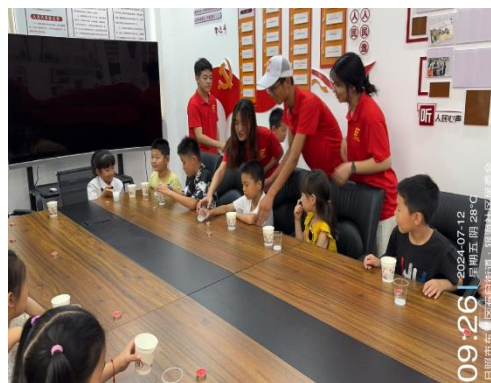
(指导教师：徐小龙；通讯员：王子润)