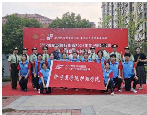
(指导教师: 任频频; 通讯员: 李振嘉)