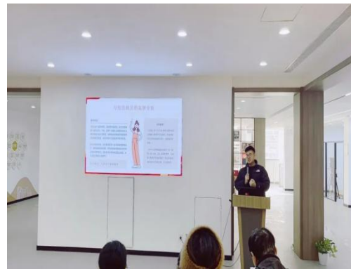
(审核: 陈 勇 撰稿: 范依宁 )