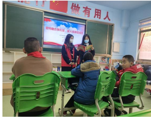
(审核: 陶圣叶 撰稿: 闫鑫)