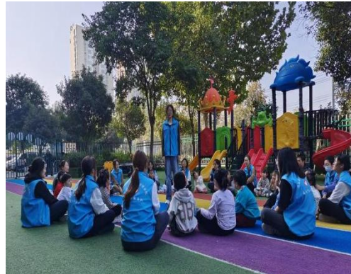
(审核: 李春雷 撰稿: 苏潇男)