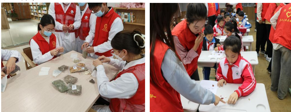
(审核：任胜利 撰稿：刘擎)

自活动开展以来，学院与多个社区以及中小学进行结对共建，开展系列活动，取得良好反响，体现了我院中西医结合的专业特点，立足专业文化，对我院课程开展、提高教学质量具有重大意义，提升我院影响力、竞争力，同时让大学生在志愿服务中增强专业认识，提高专业自信，提升专业技能，培养责任感、使命感，适应未来职业需求。