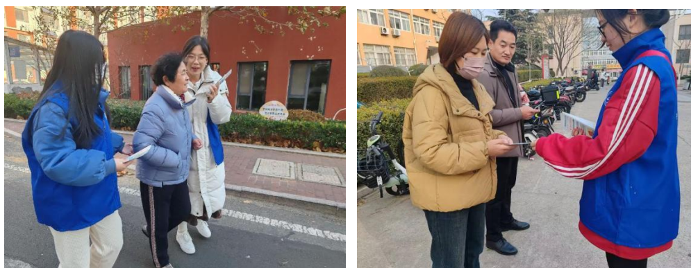
(审核：史飞 撰稿：神克洋)

本次志愿服务活动将宪法和保健相关知识带到社区，提高了居民的法律意识和健康意识，助力社区营造良好的法治环境，提高社区群众的就医体验，为推动社区发展贡献青春力量。