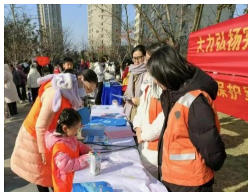
(审核: 徐宗玲 撰稿: 朱 婷 )