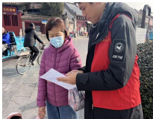
(审核：张秋梅 撰稿：韩露)